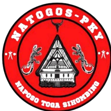
Gambar 1. Logo Naposo Toga Sihombing

Natogos merupakan singkatan dari Naposo Toga Sihombing, dan setiap simbol yang ada dalam logo Naposo Toga Sihombing memiliki arti yang berbeda. Pada sifat rumah Batak atau sering disebut rumah bolon (besar), menunjukkan bahwa orang Batak harus ingat atau tidak akan melupakan asal usulnya, yaitu tanah Batak. Sifat cicak menunjukkan bahwa orang Batak selalu berada di mana-mana. Kepala kerbau menunjukkan mentalitas orang Batak yang kuat. Setelah itu, simbol bendera Sisingamangaraja, diambil dari salah satu pahlawan Batak.