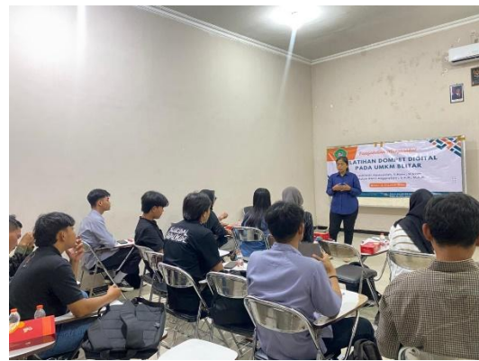
Gambar 2: Dokumentasi kegiatan 1