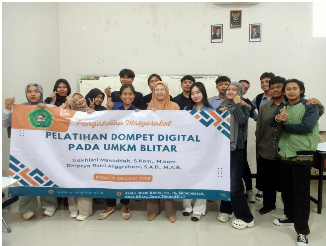
Gambar 3: Dokumentasi Kegiatan 2

Tahap ketiga yaitu evaluasi yang dilakukan dengan cara memberikan selebar kertas yang berisi tentang seberapa paham peserta terkait materi yang telah di sosialisasikan, dan hasilnya menunjukkan hal yang positif terkait pemahaman terkait literasi dompet digital. Berikut tabel hasil dari sosialisasi yang telah dilaksanakan: