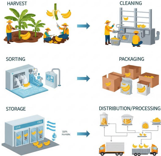
Gambar 2 Pemrosesan pisang setelah panen

Pisang idealnya dipanen saat mencapai tingkat kematangan fisiologis. Pada kondisi ini, buah telah menyelesaikan fase pembentukan pati, meskipun belum menunjukkan kematangan visual. Ciri-ciri umum pisang siap panen antara lain jari buah membulat sempurna (tidak bersudut), kulit mulai berwarna hijau kekuningan, dan umur tandan sesuai dengan varietasnya. Sebagai contoh, pisang Cavendish umumnya dipanen pada usia 90–100 hari setelah