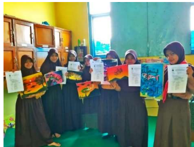
Gambar 1 Uji coba eco-canvas pada peserta didik yang mengikuti ekstrakurikuler kaligrafi

Kanvas merupakan media utama yang diperlukan sebagai media dalam seni kaligrafi. Menurut Hidayati et al., (2020) kanvas adalah kain yang berlapis cat campur lem, materialnya berasal dari kain yang tipis hingga yang tebal. Pada umumnya kanvas terbuat dari kain seperti linen dan katun. Kanvas linen memerlukan proses yang rumit dan panjang sehingga memiliki harga tinggi dan cukup sulit ditemukan di Indonesia. Kanvas lukis dari katun banyak digunakan untuk pemula. Kanvas katun memiliki harga yang lebih terjangkau dan bertekstur lembut sehingga proses melukis menjadi lebih mudah. Menurut Suryana et al., (2021) kanvas dibuat dengan olahan yang mudah diperoleh, dan cara membuatnya mudah dengan hasil yang ekonomis. Salah satu alternatif penggunaan kanvas kain sebagai media dalam kaligrafi yaitu dengan menggunakan eco-canvas. Eco-canvas merupakan alternatif media yang ramah lingkungan dalam kaligrafi karena terbuat dari bahan yang alami ampas tebu, jerami, dan kulit jagung. Kualitas dan efektivitas eco-canvas di uji pada penelitian ini dengan cara melihat respons dari peserta didik yang mengikuti ekstrakurikuler kaligrafi. Adapun dokumentasi uji coba eco-canvas dan hasil kaligrafi peserta didik dapat dilihat pada Gambar 1 dan Gambar 2.