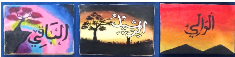
Gambar 2 Hasil kaligrafi peserta didik yang mengikuti ekstrakurikuler kaligrafi