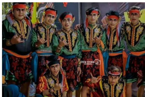
Gambar. 4 Team Jaranan

yang diyakini memiliki kekuatan itu adalah roh leluhur. Karena itu pada hakikatnya berbagai macam benda, tingkah laku, gerakan serta nyanyian diciptakan dalam rangka persembahkan kepada roh leluhur, dalam rangka mencari perlindungan dan keselamatan hidup. Dalam perkembangannya, kesenian jaranan mengalami pergeseran nilai.