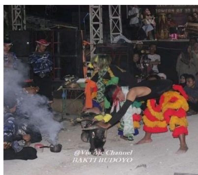
Gambar 2. Kesenian Jaranan

celengan, barongan, dan pemain jaranan sendiri. Selain itu, terdapat pula alat music yang mengiringi pentas seni jaranan, seperti: gamelan, kenong, kendang, dan gong. Jaranan pertama kali masuk ke Kediri pada abad ke – 19 masa Hindia Belanda dan dibawa oleh parawarok dari Ponorogo. Kesenian ini kemudian berkembang di Kediri karena banyak warok Ponorogo yang mengambil bocah kecil dari Nganjuk, Madiun, dan sekitarnya untuk menjadi penari Jaranan. Pada mulanya, Jaranan selalu bersifat sakral dan berhubungan dengan hal –hal gaib. Selain untuk tontonan, Jaranan juga digunakan untuk upacara – upacara resmi yang berkaitan dengan roh leluhur keraton. Namun, seiring berjalannya waktu jaranan mulai dihaluskan dari segi tarian, dandanan, dan music untuk memperbaiki citranya di Masyarakat.