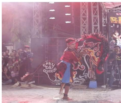
Gambar 5. Penari Jaranan

Fungsi kesenian Jaranan Bakti Budoyo bagi masyarakat penikmatnya saat ini seperti pada Gambar 5. Kesenian Jaranan Bakti Budoyo mengalami perubahan fungsi dalam perkembangannya. Kesenian Jaranan Bakti Budoyo dulu hanya mempunyai fungsi primer saja namun setelah berkembangnya zaman bergeser menjadi mempunyai 2 fungsi yakni primer dan sekunder, fungsi primer dulu dengan sekarang juga berbeda. Perbedaannya terlihat pada dulu sebagai sarana ritual sekarang menjadi media hiburan. Dalam pertunjukan kesenian Jaranan Bakti Budoyo juga tidak lepas dari kepentingan yang bersangkutan yaitu warga Desa Kedamean Kecamatan Kedamean Kabupaten Gresik, maka dapat dikatakan bahwa seni memiliki peran penting dalam kehidupan masyarakat baik secara individu maupun kelompok. Berdasarkan fungsi kesenian Jaranan Bakti Budoyo yang bersifat kerakyatan memiliki fungsi yang sangat kompleks. Kesenian kesenian Jaranan Bakti Budoyo memiliki Fungsi Primer antara lain seperti yang diungkapkan oleh Soedarsono, (2001: 170 - 172) yaitu sebagai berikut: