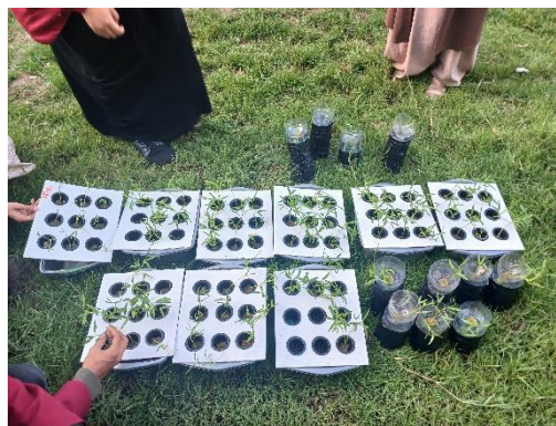
Gambar 1: Wicksystem Yang Dapat Dihasilkan Dari Baskom Plastik

Dalam sesi ini, pemateri juga memperlihatkan contoh hasil penerapan sistem hidroponik wick system dengan media baskom yang telah dimodifikasi menjadi wadah tanam fungsional dan efisien untuk skala rumah tangga. Pendekatan ini sejalan dengan prinsip keberlanjutan, yaitu memanfaatkan sarana sederhana untuk menciptakan nilai guna dalam kegiatan pertanian perkotaan (Ecobrick 2022). Selain itu, sistem wick atau sumbu merupakan salah satu teknik hidroponik yang mudah diterapkan, hemat biaya, dan sesuai untuk skala rumah tangga maupun komunitas kecil (Hidayati 2024).